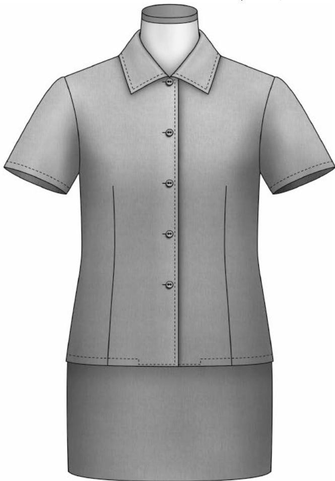
〈シーチング組み立て完成図〉