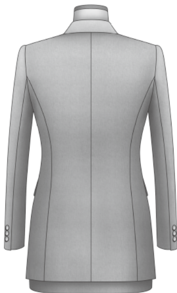
〈シーチング組み立て完成図〉