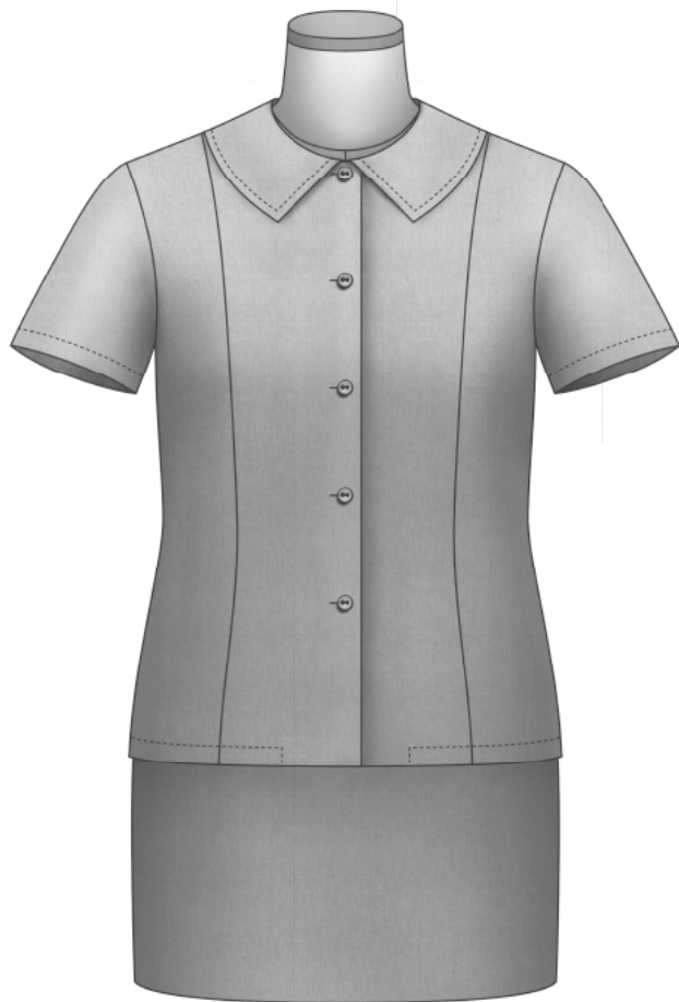
〈シーチング組み立て完成図〉